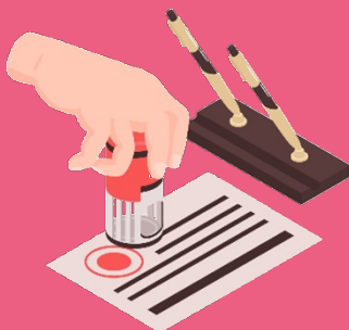
ผู้อนุมัติพิจารณาอนุมัติ