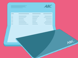
พนักงานส่งคืนสมุดบัญชีให้ลูกค้า