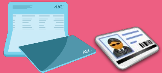
ลูกค้าแจ้งจำนวนเงินถอนพร้อมยื่น สมุดเงินฝากและบัตรประจำตัวประชาชน