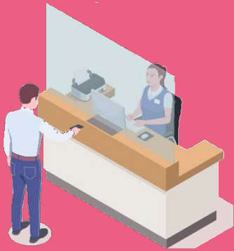
ลูกค้าติดต่อหน้าเคาน์เตอร์