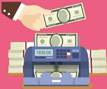
พนักงานตรวจนับเงิน