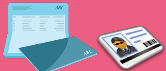
พนักงานส่งมอบเงินพร้อมคืนสมุดบัญชี และบัตรประจำตัวประชาชนให้ลูกค้า