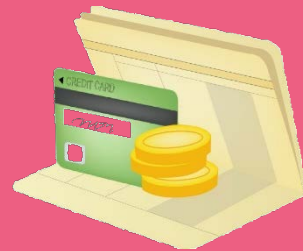
ลูกค้าแจ้งจำนวนเงินฝาก พร้อมยื่นเงินและสมุดเงินฝาก